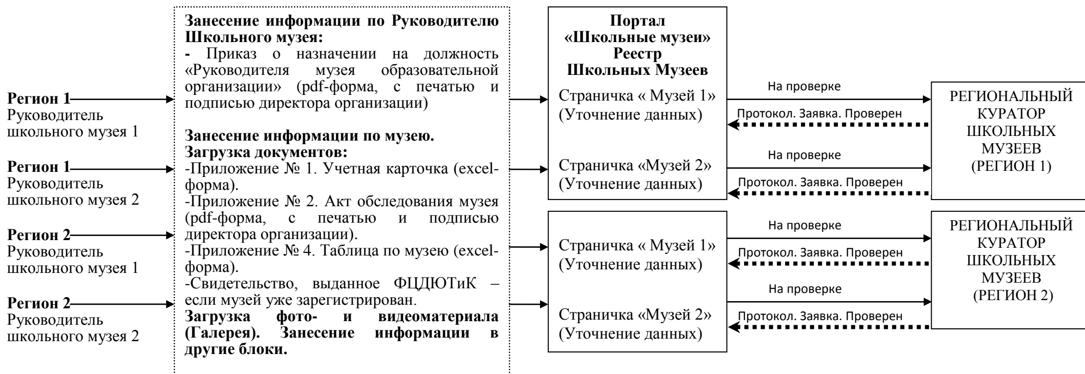
СХЕМА 1 Взаимодействие «Руководитель Школьного музея» – «Региональный Куратор Школьных музеев»