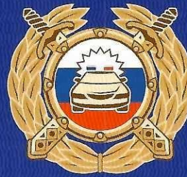
Госавтоинспекция МВД России

Буклет изготовлен по заказу Минпросвещения России в рамках реализации федеральной целевой программы «Повышение безопасности дорожного движения в 2013–2020 годах».